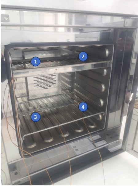
Diagram de Posición de Sensores (Sensor Position Diagram)