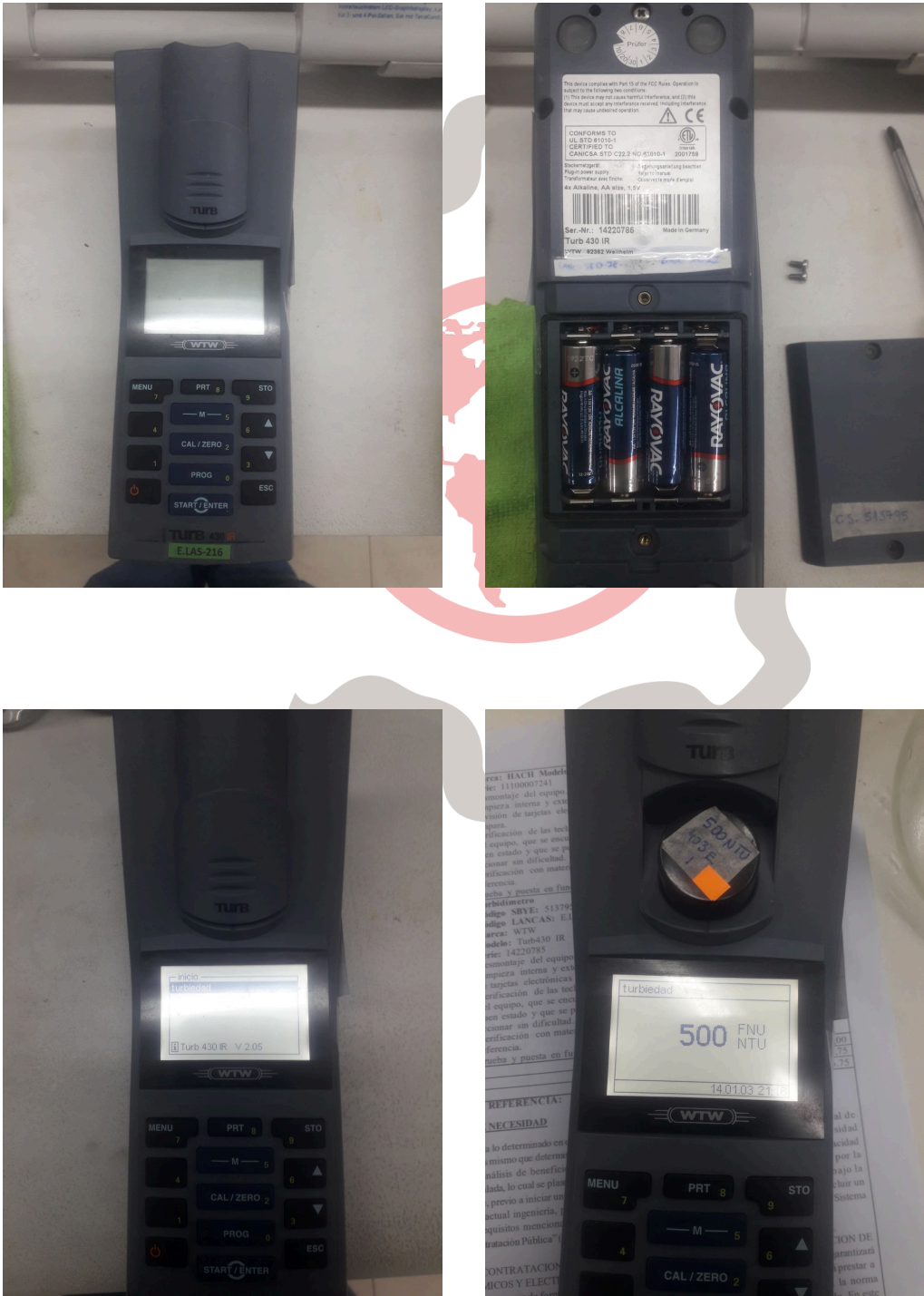
Fig. 1 Mantenimiento preventivo básico