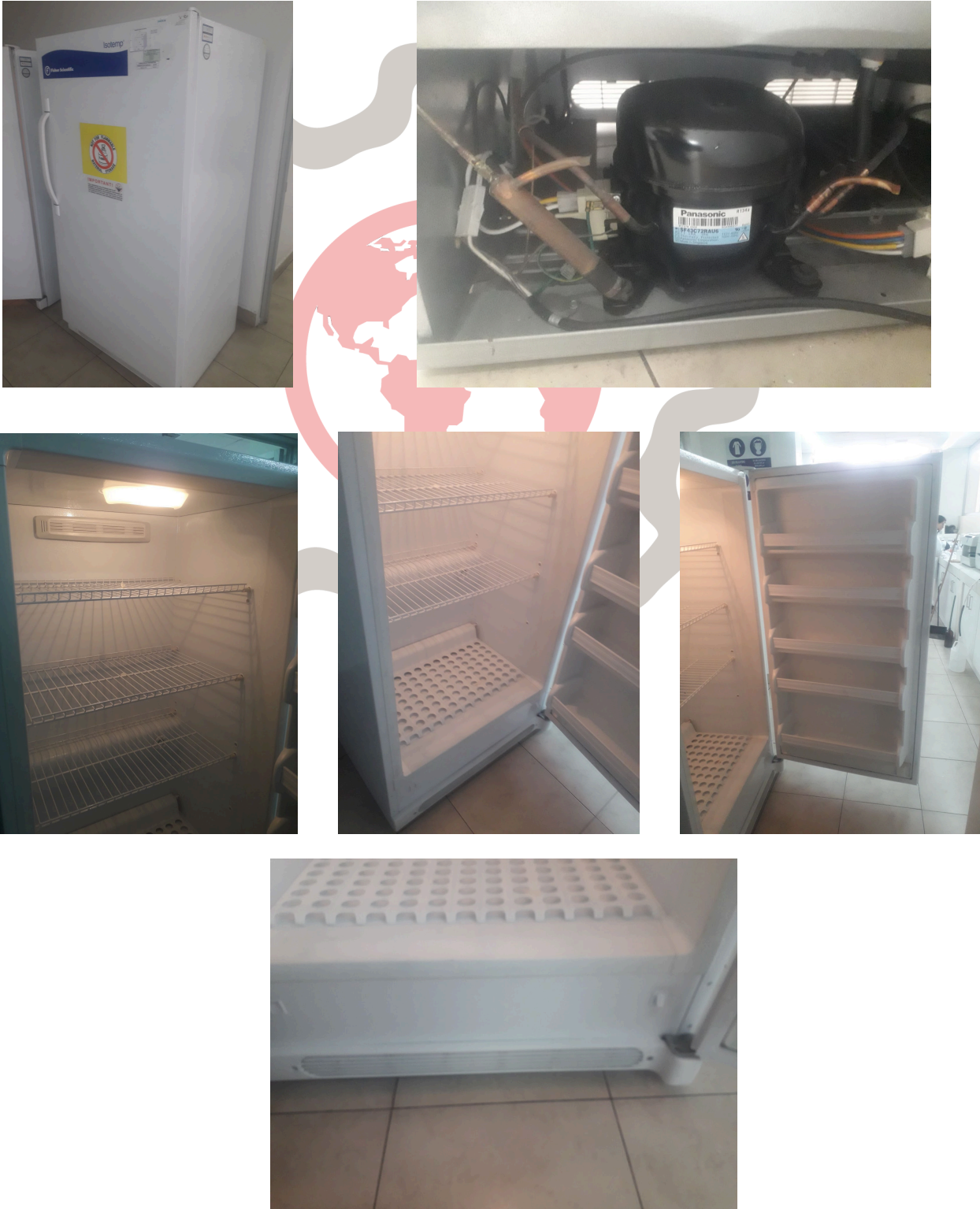
Fig. 1 Mantenimiento preventivo básico