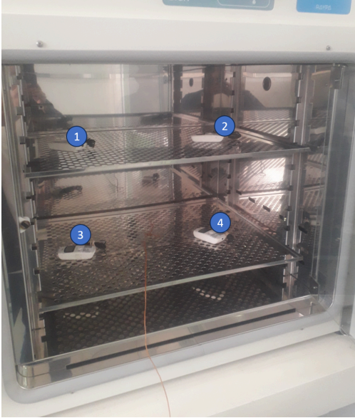
Diagram de Posición de Sensores (Sensor Position Diagram)