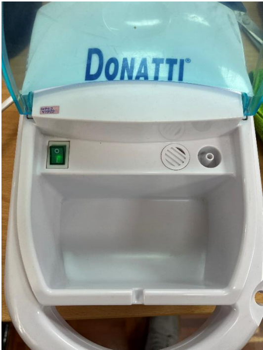
Figura 3. Pruebas de Funcionamiento.