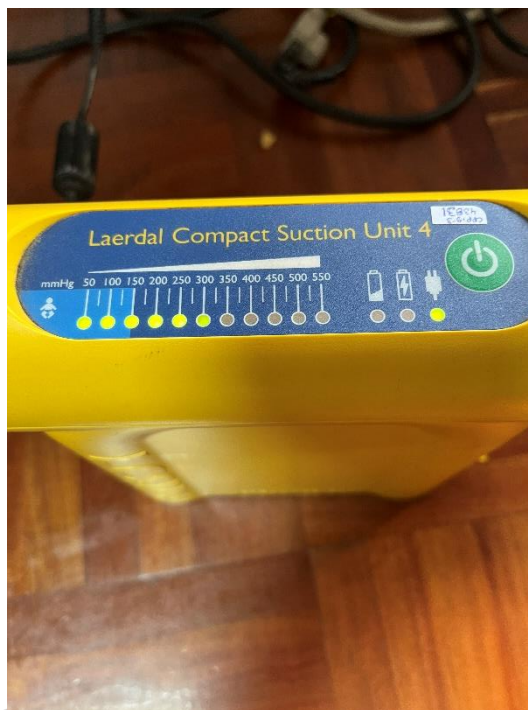
Figura 2. Pruebas de Funcionamiento