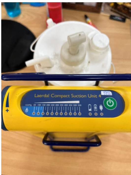
Figura 1. Vista General del Equipo.