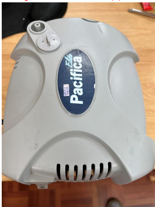
Figura 3. Pruebas de Funcionamiento.