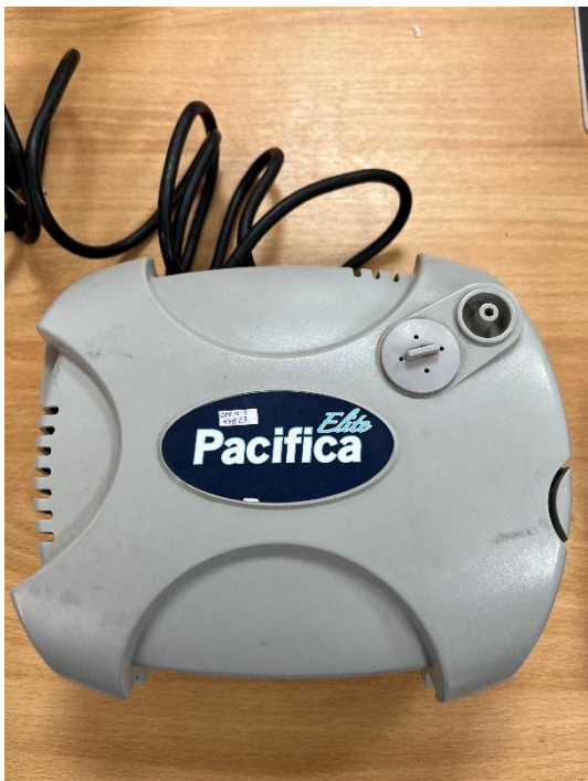
Figura 1. Vista General del Equipo.