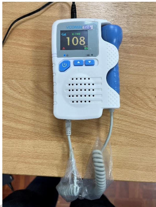
Figura 2. Pruebas de Funcionamiento.