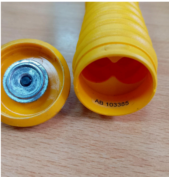
Fig. 2 Conexión batería