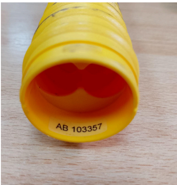
Fig. 2 Conexión batería