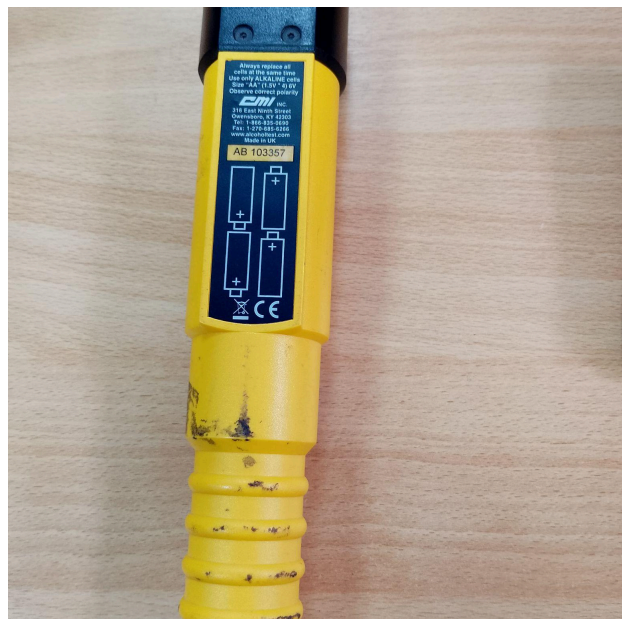
Fig. 1 Vista general del Equipo (Vista frontal y posterior)