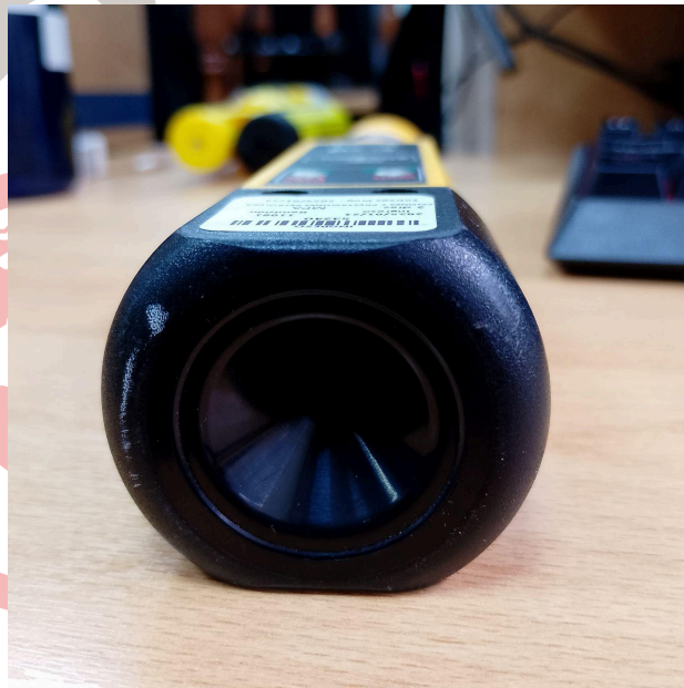
Fig. 3 Boquilla muestra