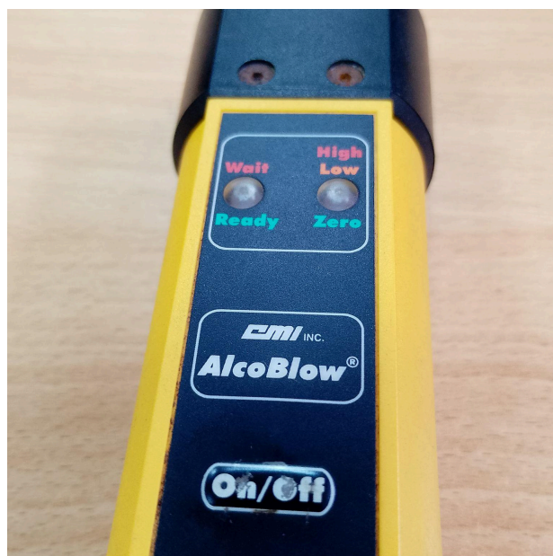
Fig. 1 Vista general del Equipo (Vista frontal y botones)