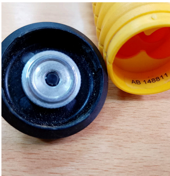
Fig. 2 Conexión batería