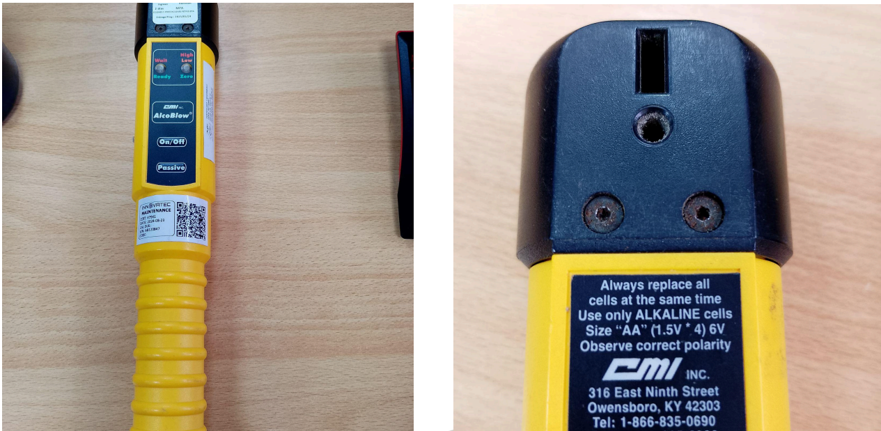
Fig. 1 Vista general del Equipo (Vista frontal y botones)