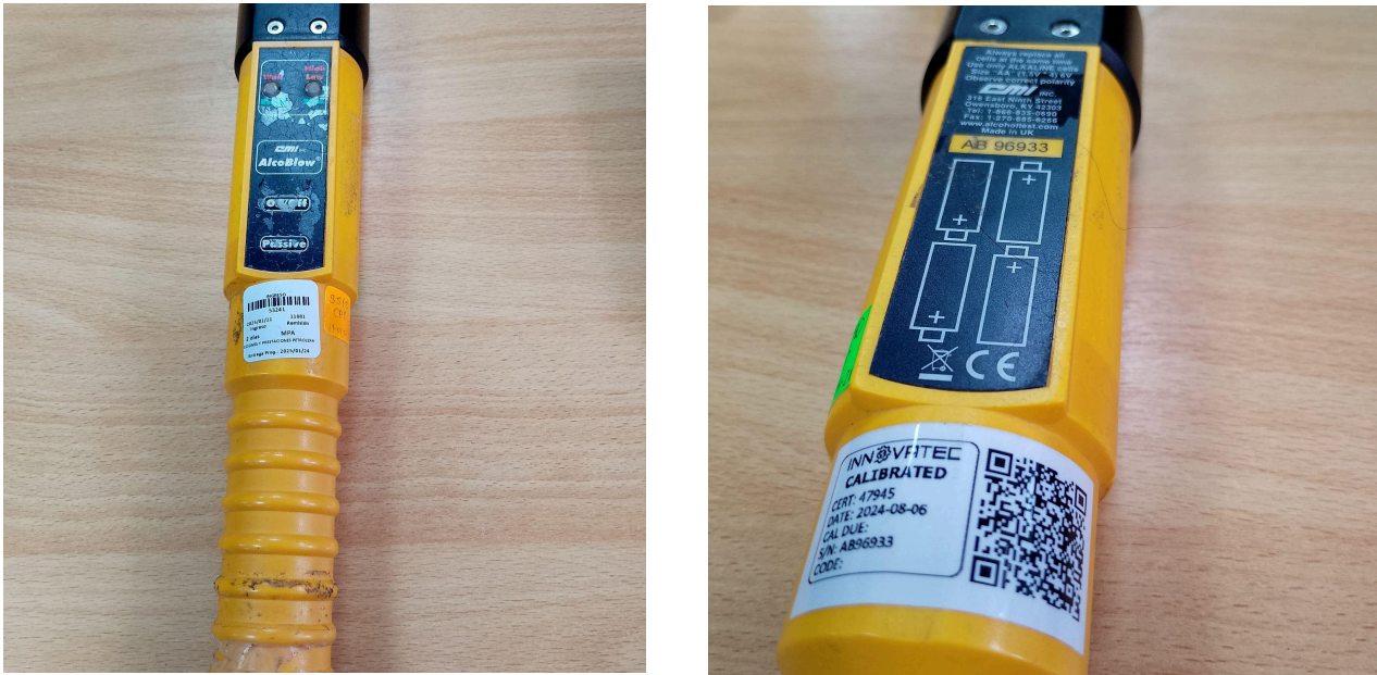
Fig. 1 Vista general del Equipo (Vista frontal y botones)