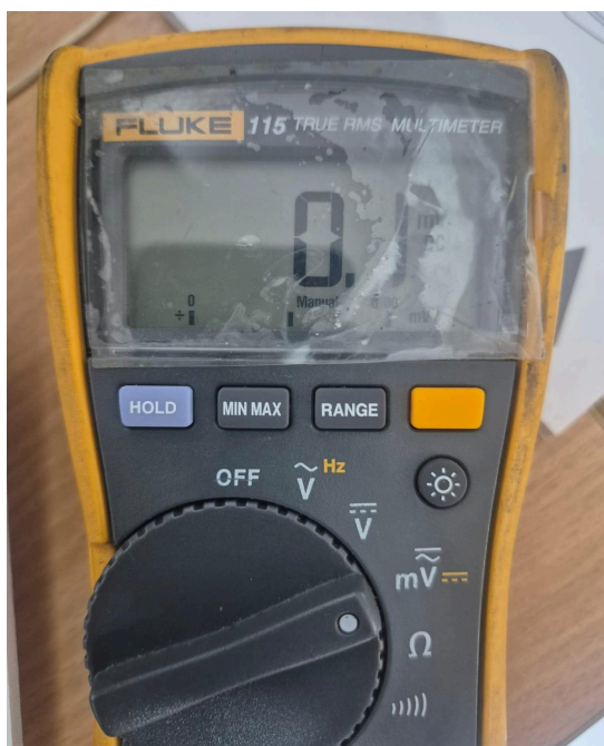
Figura 4. Valor medido en la señal de salida de la balanza sin ningún peso.