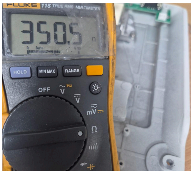
Figura 3. Valor de resistencia de salida de la celda.