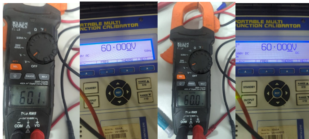
Fig. 6 Prueba de voltaje AC/DC @ 60V