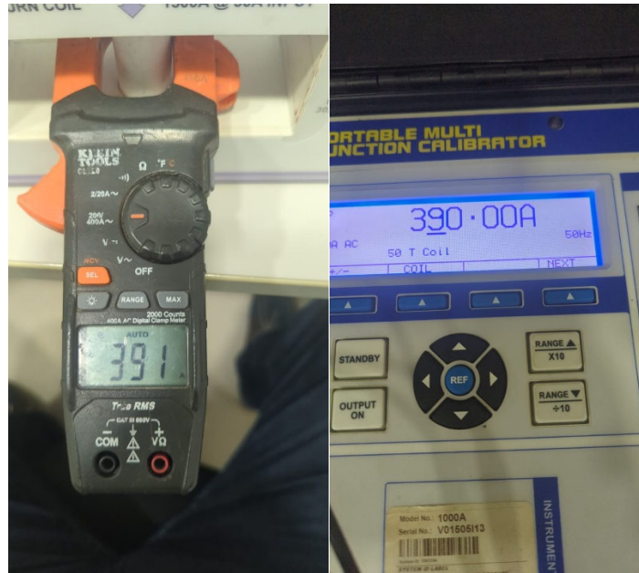
Fig. 5 Prueba medición de corriente rango 400AAC @ 390AAC