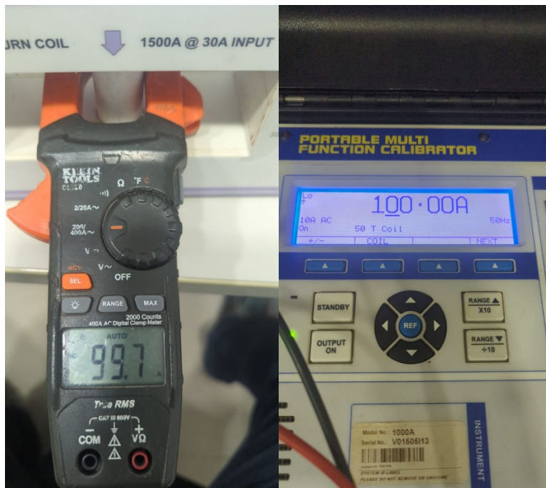
Fig 4 Prueba medición de corriente rango 400AAC @ 100AAC