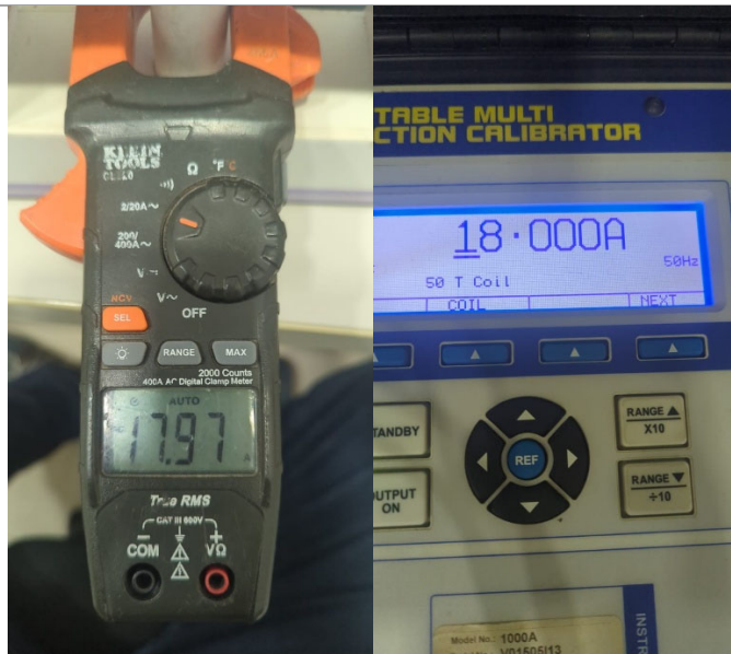
Fig. 3 Prueba medición de corriente Rango 20AAC @18AAC