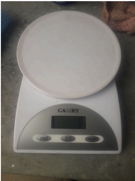
Presencia de residuos químicos (manchas sobre el Plato)