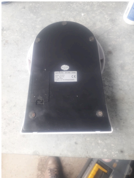
Presencia de residuos en la parte inferior de la Balanza