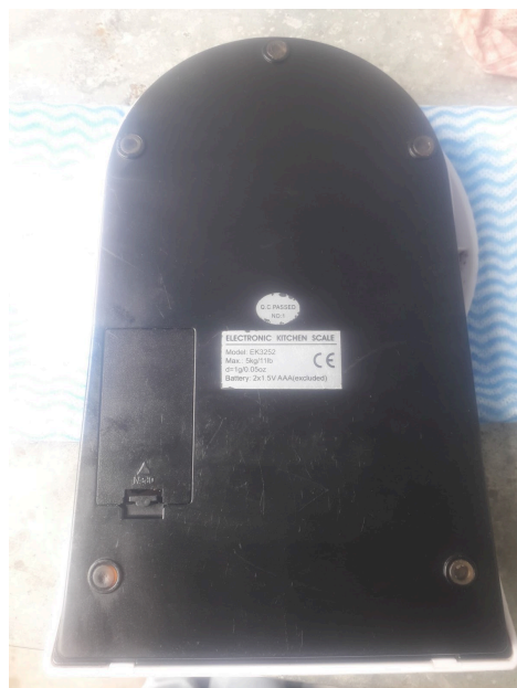
Vista de la parte inferior de la Balanza luego del Mantenimiento