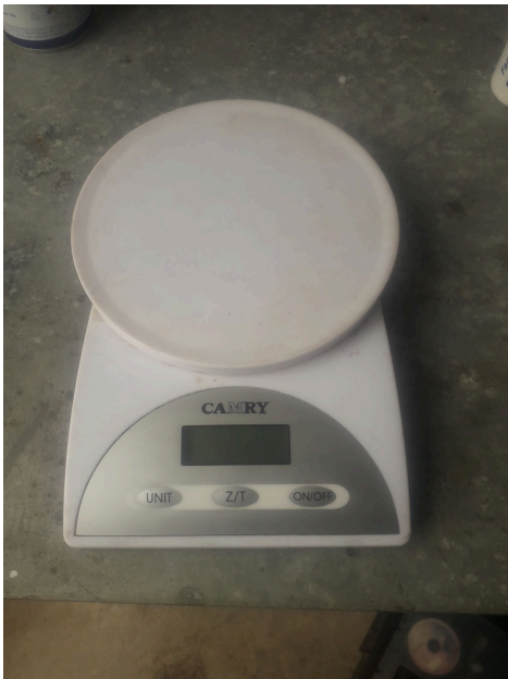
Vista general del equipo