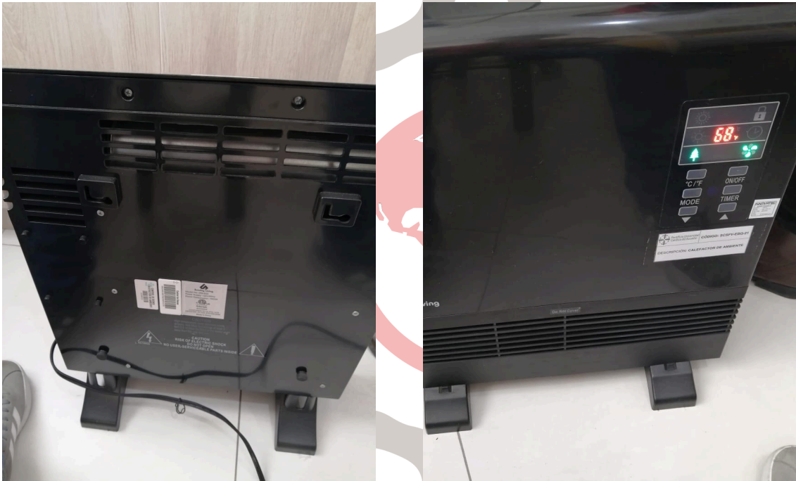
Figura 2. Funcionamiento y encendido del equipo..