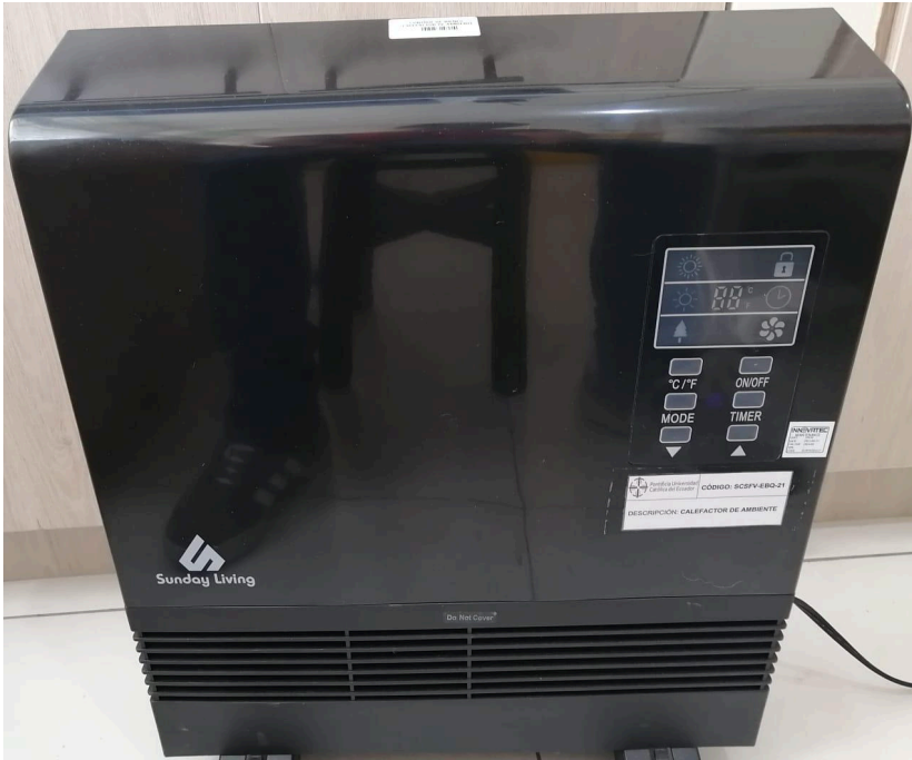
Figura 1. Vista frontal del equipo.