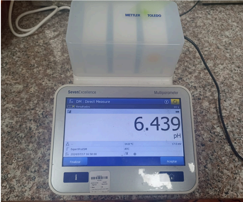
Figura 1. Vista general del equipo.