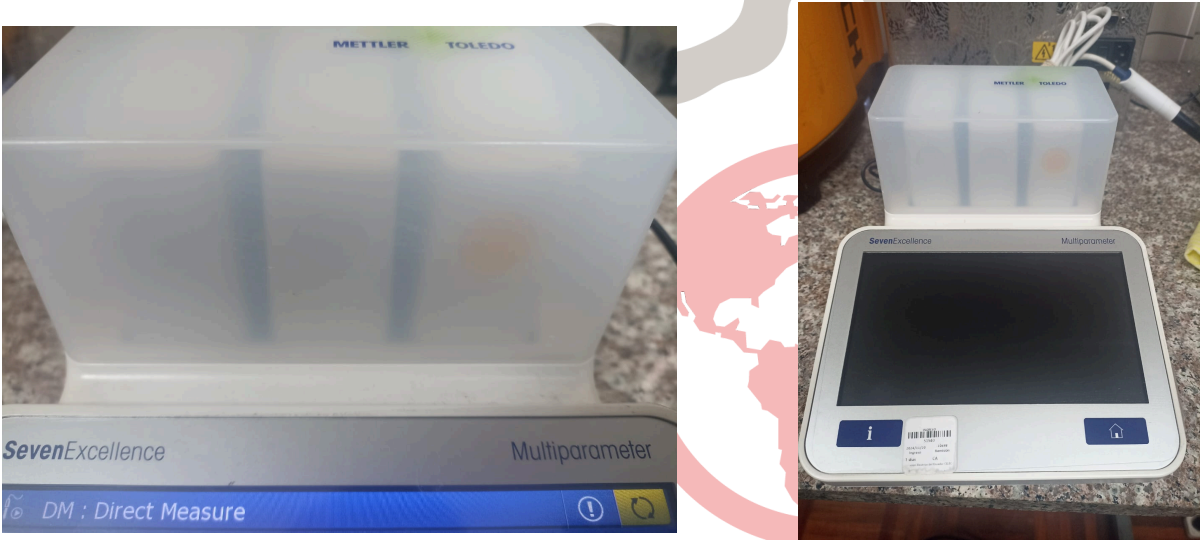
Figura 2. Equipo libre de impurezas.