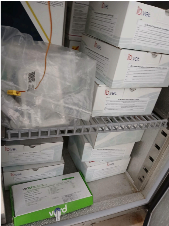
Figura 3. Refrigeradora despues de limpieza y pruebas de funcionamiento.