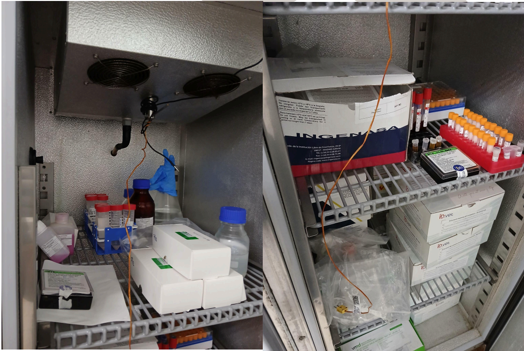
Figura 2. Revisión del Interior de la Refrigeradora.