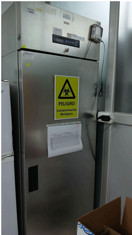
Figura 1. Vista General del Equipo.