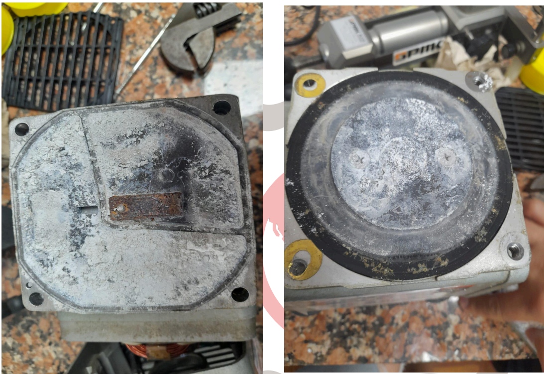
Figura 2. Acumulación de material particulado .