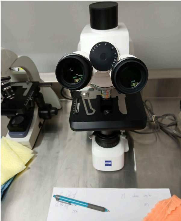
Figura 1. Vista frontal del equipo.