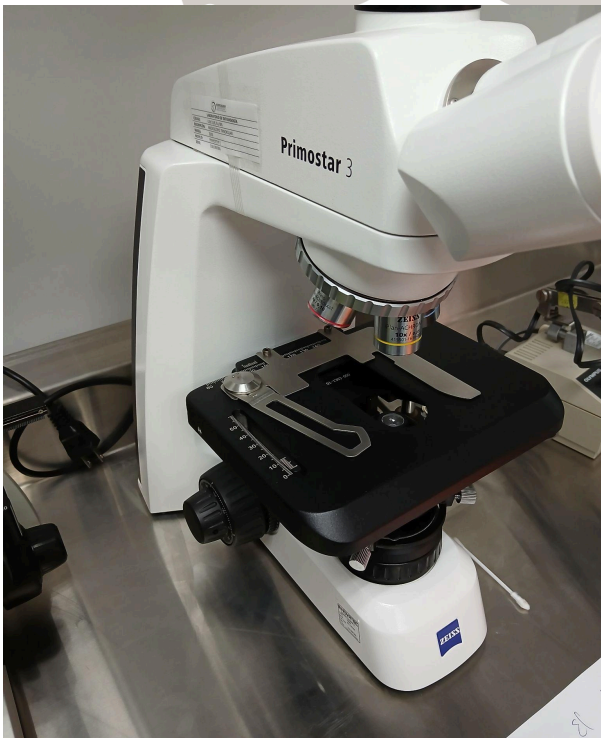
Figura 3. Vista general del equipo.