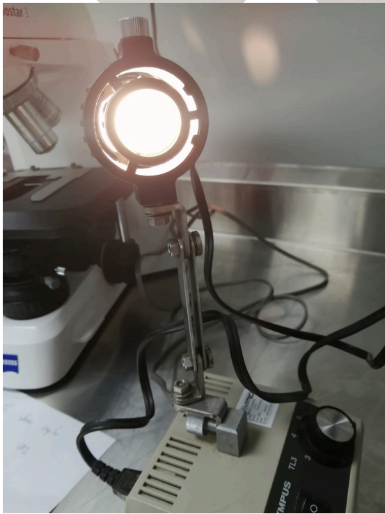
Figura 4. Linterna funcionamiento.