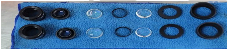
Figura 2. Accesorios internos.