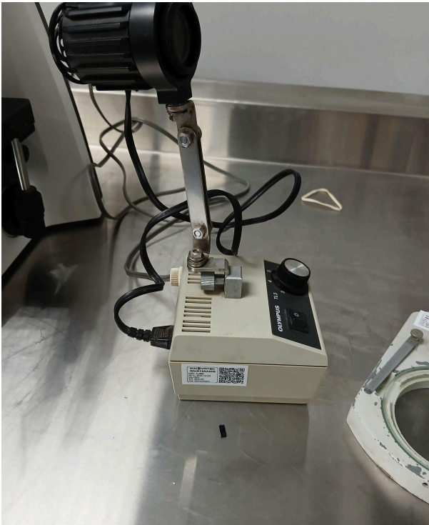
Figura 3. Linterna.