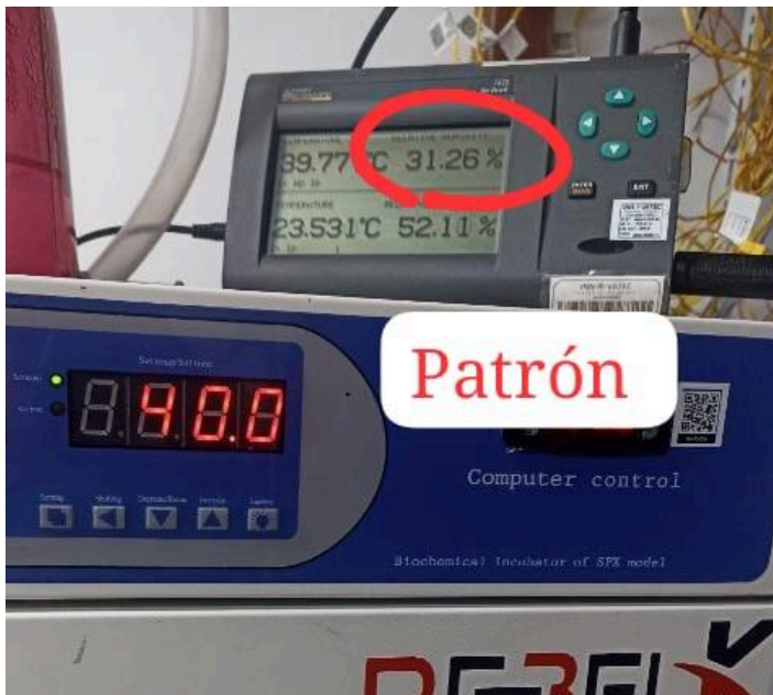
Figura 1: Patrón INNOVATEC en punto 30%HR.