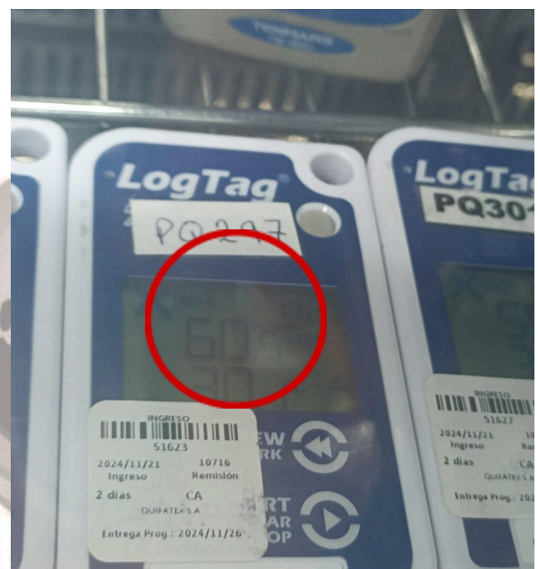
Figura 4: Error en punto 50%HR equipo 51623-PQ297.