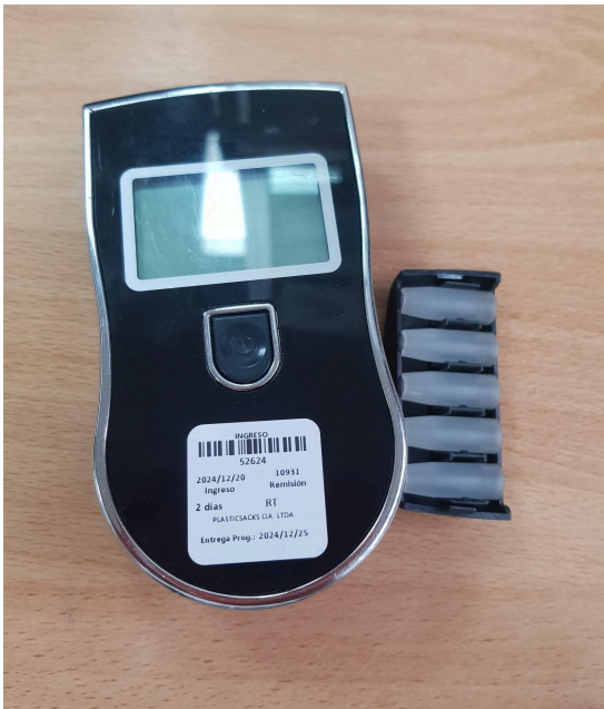
Fig. 1 Vista general del Equipo