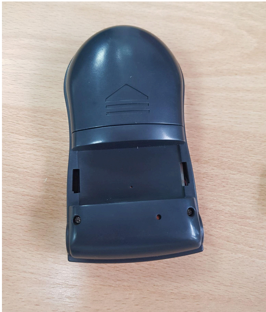
Fig. 2 Vista posterior (Carcasa)