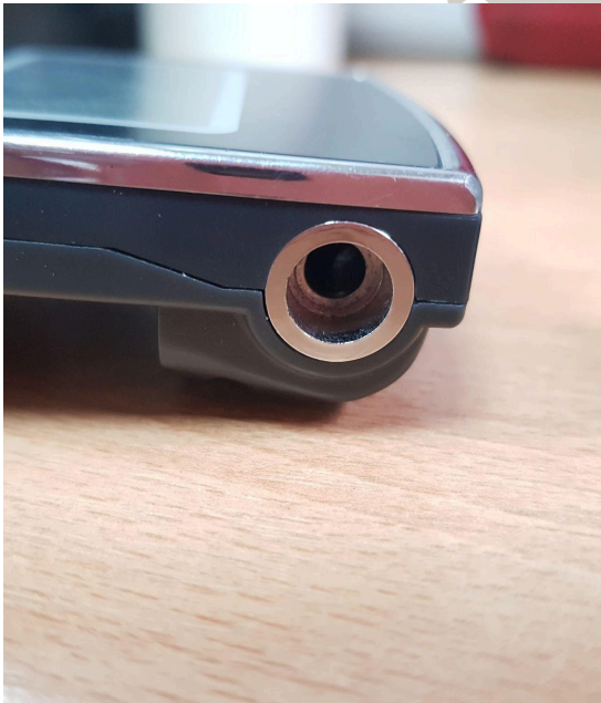
Fig. 3 Entrada de muestra