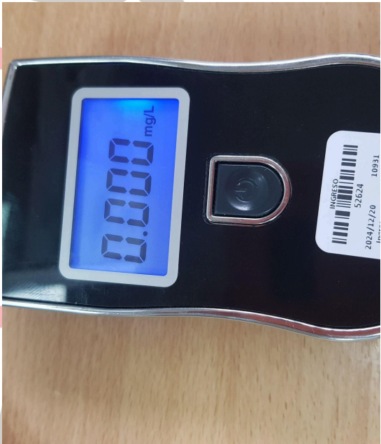
Fig. 4 Prueba patrón