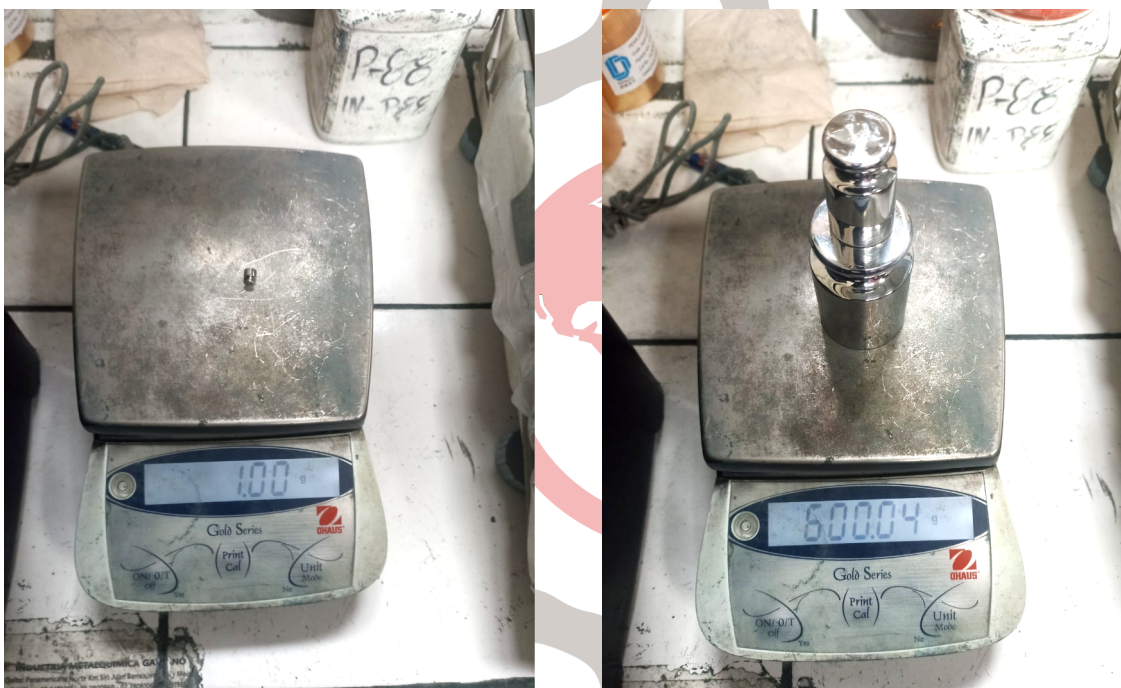
Figura 2. Equipo libre de impurezas.