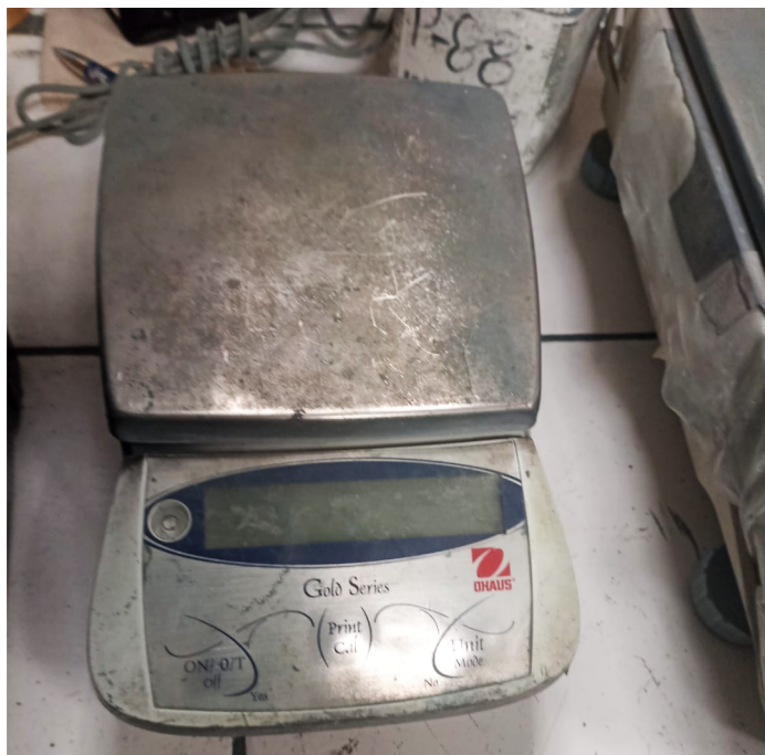
Figura 1. Vista frontal del equipo.