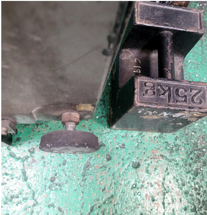
Figura 4. Celdas inferiores.