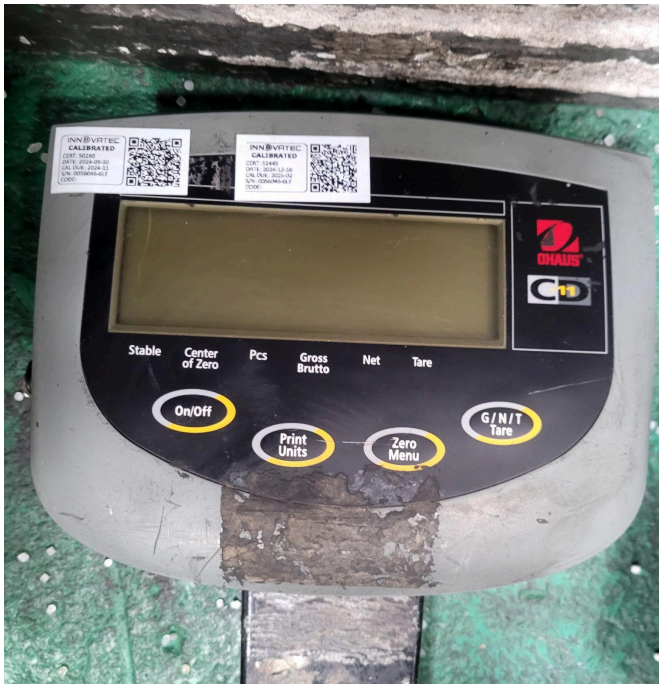
Figura 1. Display antes de la limpieza.