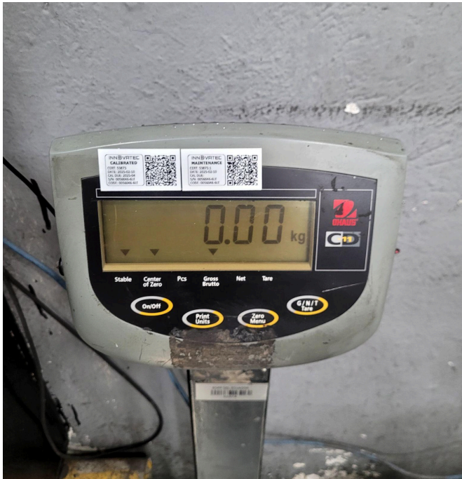
Figura 2. Display después de la limpieza.