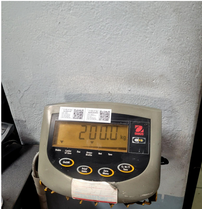
Figura 2. Display después de la limpieza.