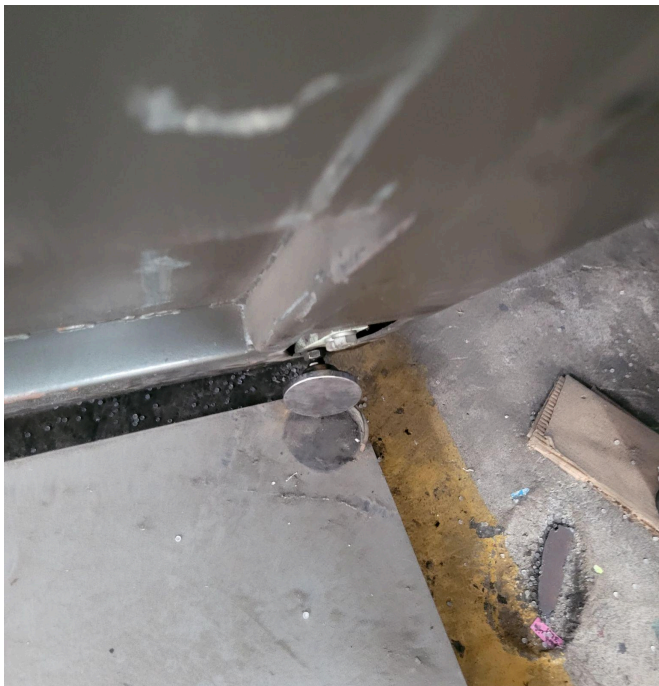
Figura 4. Celdas inferiores .