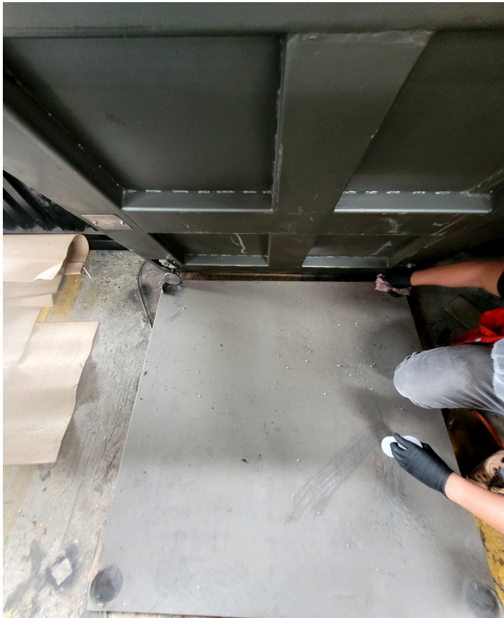
Figura 6. Estado debajo de la base del equipo.