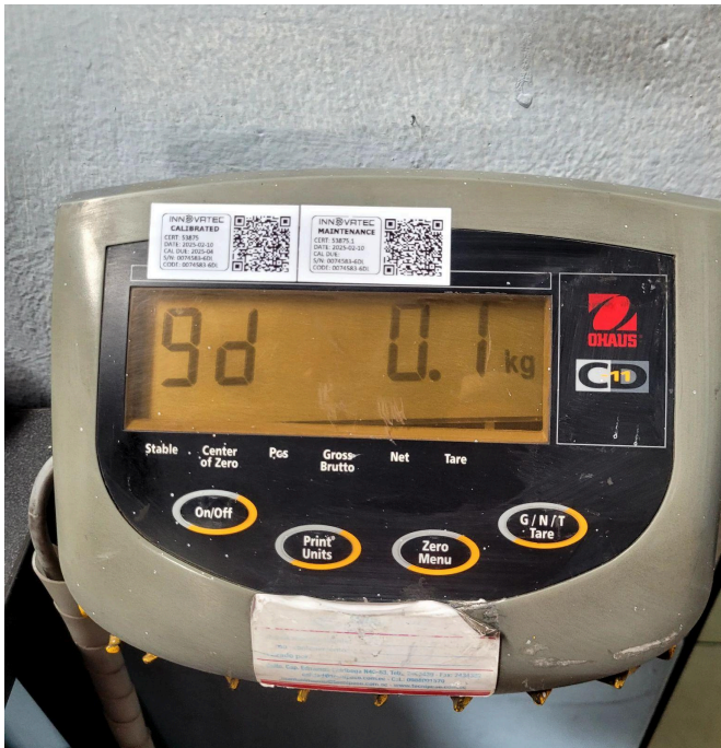
Figura 1. Display antes de la limpieza.