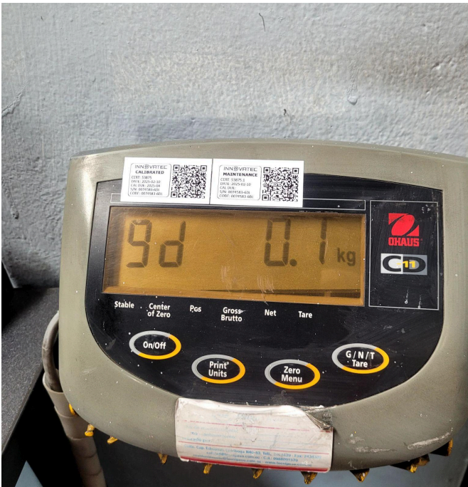
Figura 5. Configuración de la resolución de la balanza.