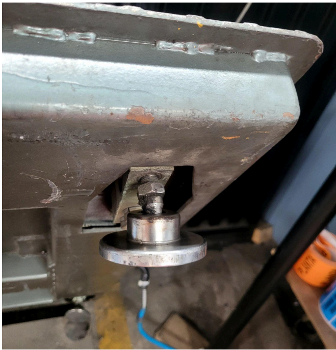
Figura 3. Celdas superiores .