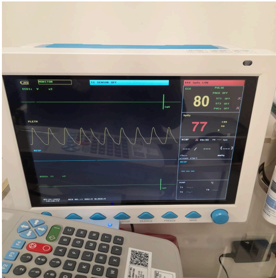
Figura 2. Funcionamiento de equipo