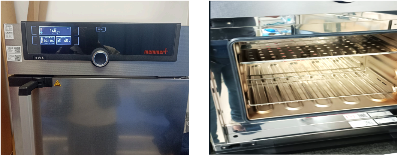
Figura 1. Funcionamiento y Mantenimiento del Equipo