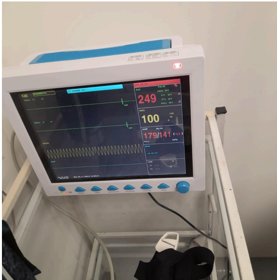
Figura 2. Funcionamiento de equipo