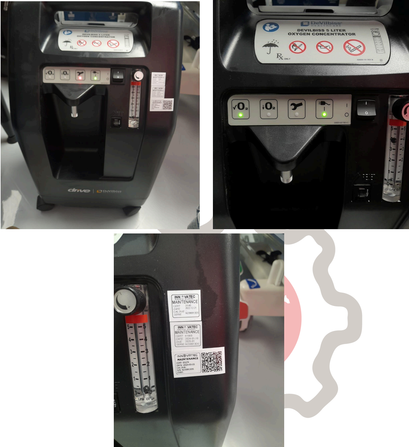
Figura 1. Vista General del equipo y mantenimiento.