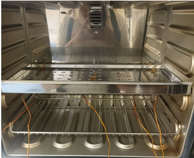
Figura 1. Funcionamiento y Mantenimiento del Equipo