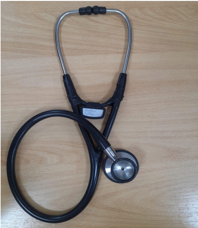
Figura 1. Vista general del equipo