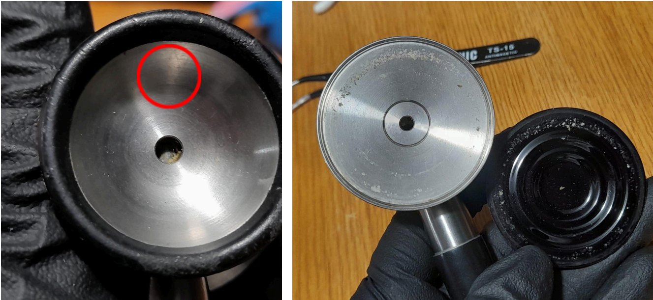
Figura 2. Residuos biológicos antes de mantenimiento