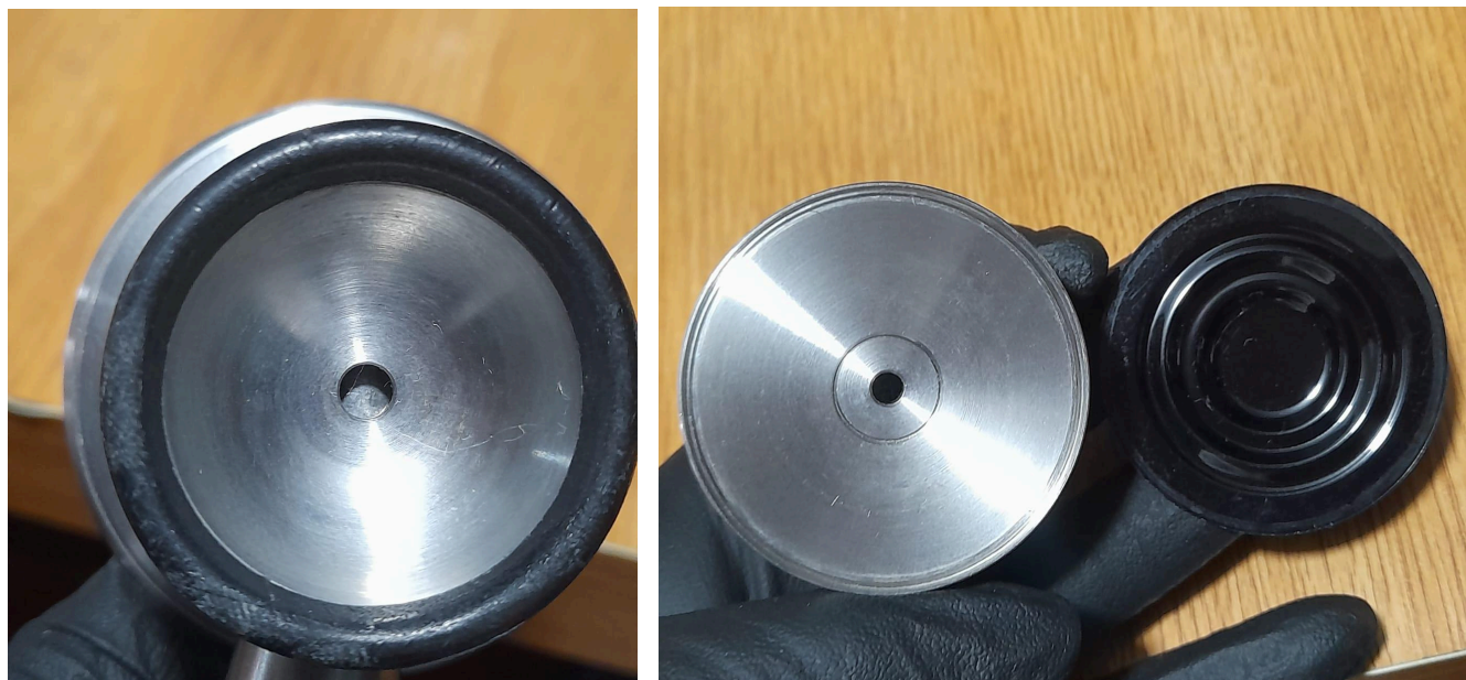
Figura 3. Equipo después de mantenimiento