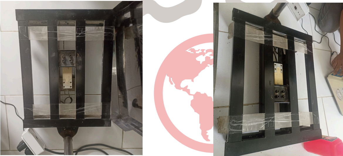
Figura 2. Equipo libre de impurezas