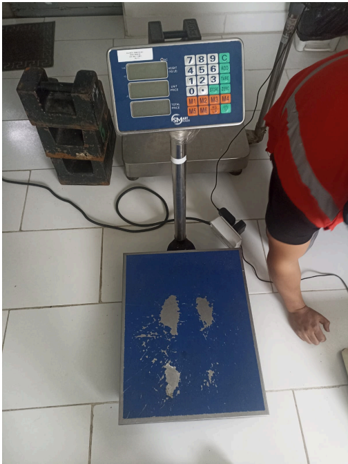
Figura 1. Vista general del equipo.