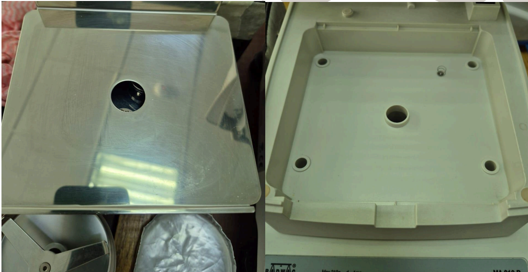
Figura 2. Elementos del equipo.