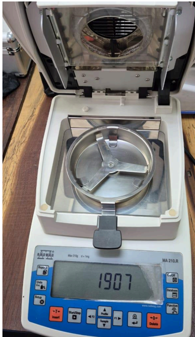
Figura 1. Vista frontal del equipo.