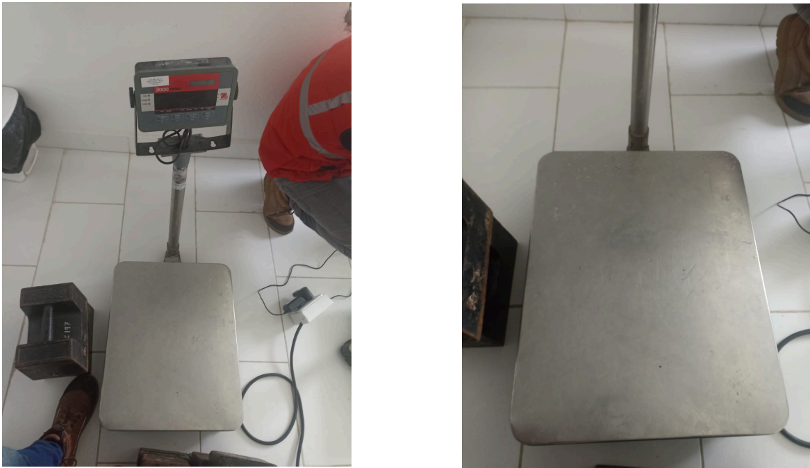
Figura 1. Vista general del equipo.