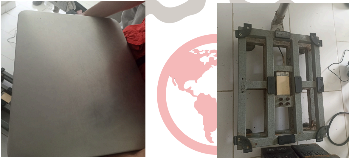
Figura 2. Equipo libre de impurezas