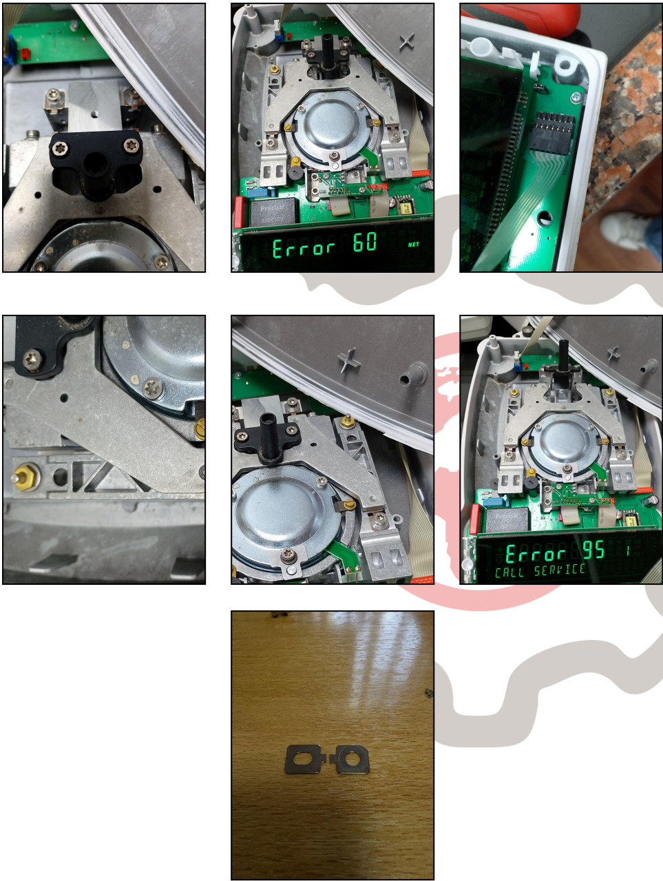
Fig. 1 Revisión Técnica