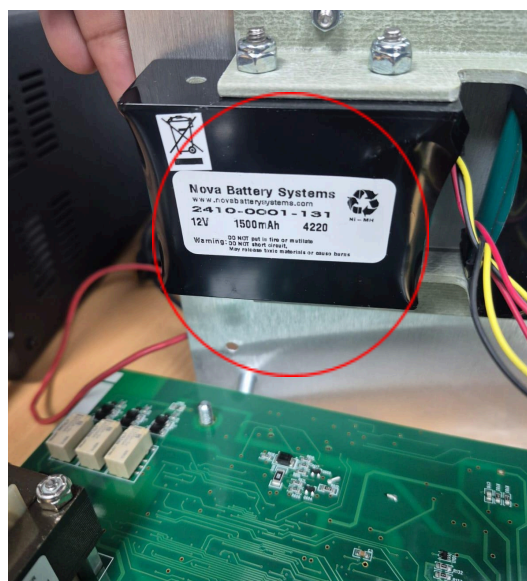
Figura 2. Especificaciones del valor nominal de la batería.