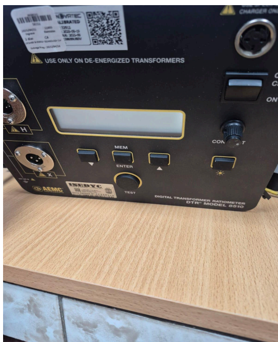
Figura 4. Encendido del equipo.