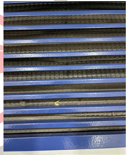
Fig. 1 Mantenimiento del Ultracongelador