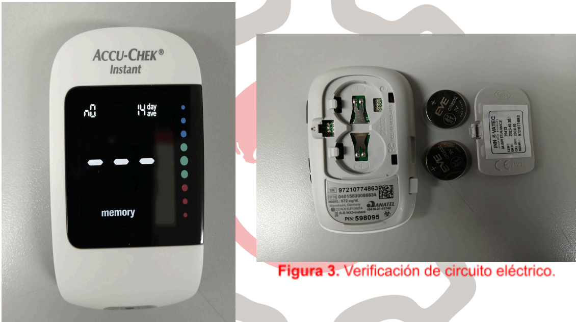
Figura 2. Equipo encendido.