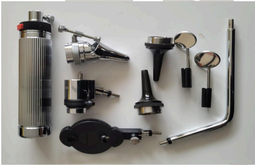
Figura 2. Verificación de funcionamiento de piezas.