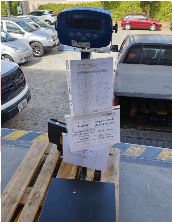
Equipo libre de impurezas