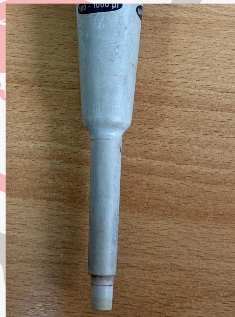
Fig. 1: Mantenimiento preventivo básico