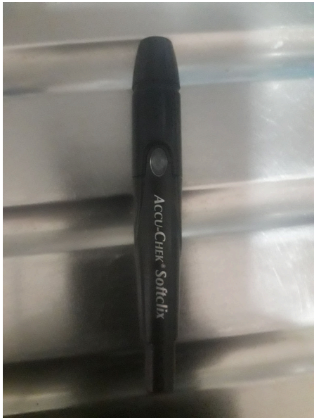
Figura 2. Lancero en buen estado y funcionando