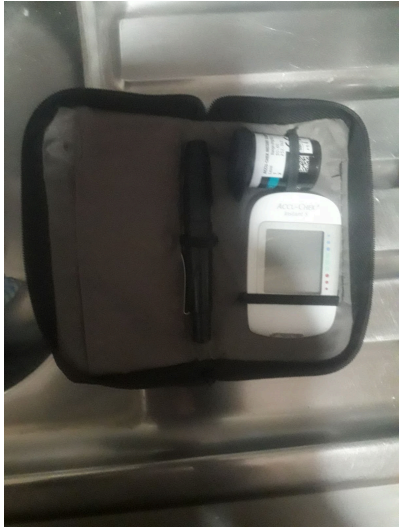
Figura 2. Vista general del equipo