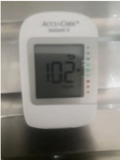
Figura 1. Lector funcionando correctamente