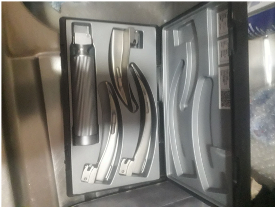
Figura 1. Vista General del Equipo.