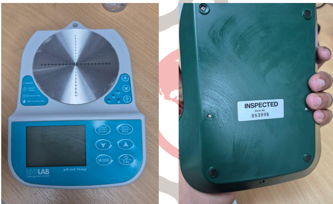
Figura 2. Parte posterior y frontal del equipo.