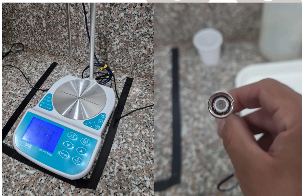
Figura 4. Encendido del equipo y estado del conector del sensor.