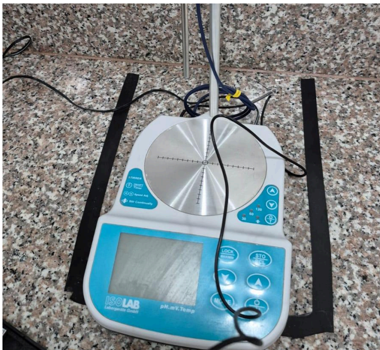
Figura 1. Vista frontal del equipo.