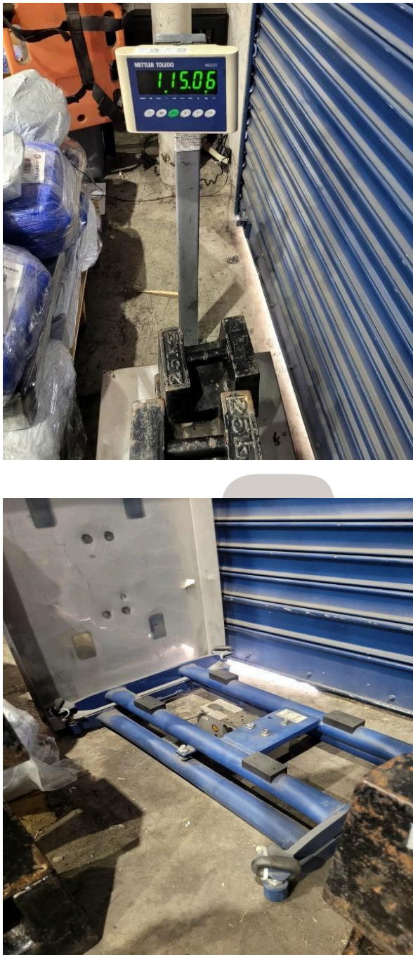
Figura 1. Vista general del equipo.