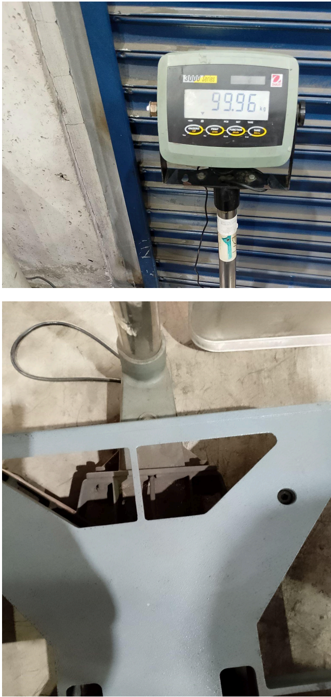
Figura 1. Mantenimiento preventivo del equipo.