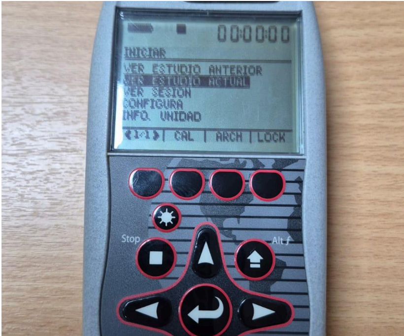
Figura 1. Encendido del equipo.