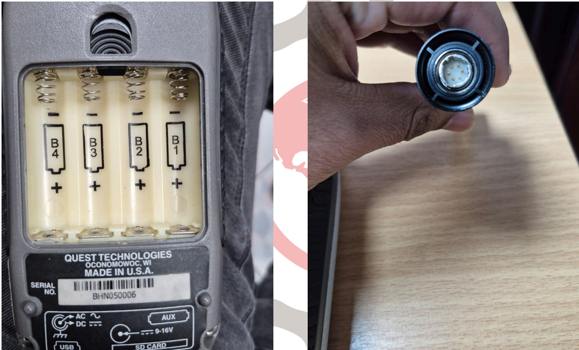
Figura 2. Puerto de baterías y vista del puerto de conexión del sensor.