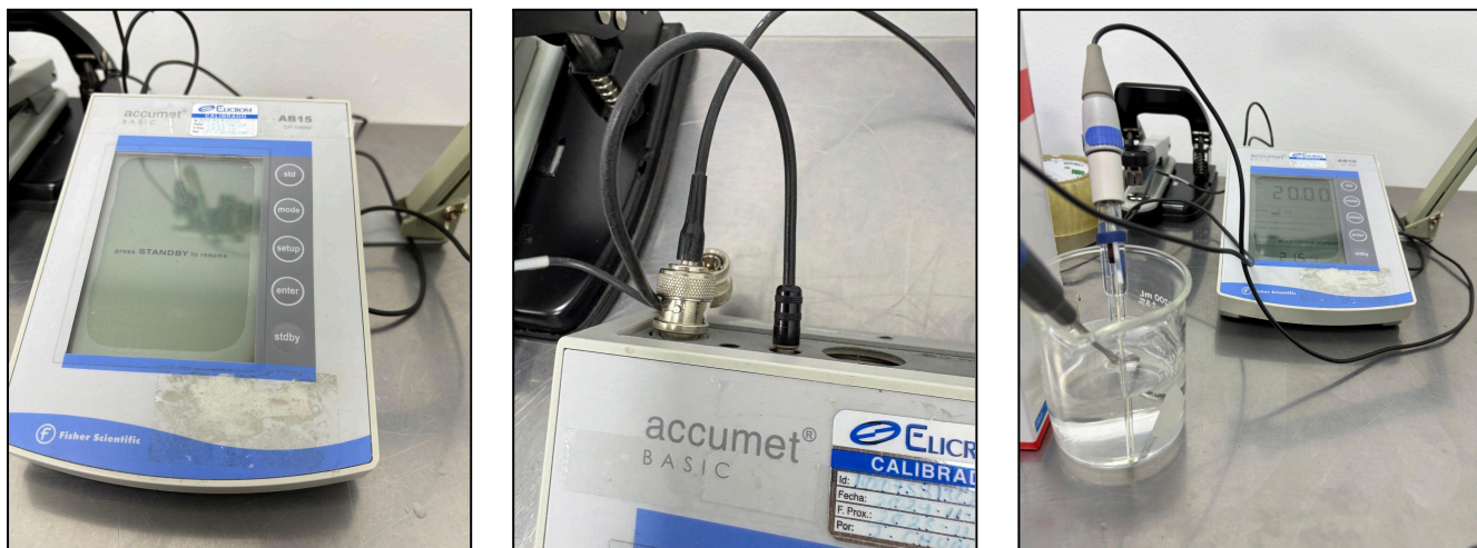
Fig. 1 Vista general del equipo